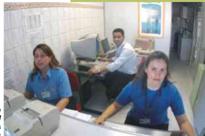
Trabalho é feito em ambiente agradável e em cadeiras confortáveis

mais de uma linha, em menos de uma hora, o número de passageiros também aumentou. Em dezembro do ano passado houve cerca de 23 mil viagens com Vale-Transporte (VT), já em maio esse número saltou para 38 mil viagens. Até os passageiros que não tem cartão consideram uma boa idéia andar de ônibus: saltaram de 58 mil viagens em dezembro para 75 mil em maio.