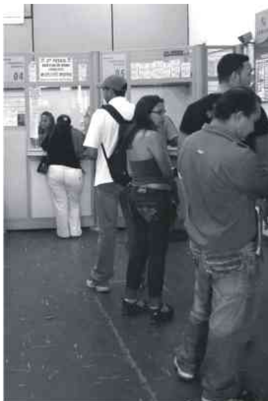
Contas e mais contas para pagar: se não houver planejamento, não sobra dinheiro nem para a aposta, muito menos para despesas essenciais, como as com o supermercado e a farmácia