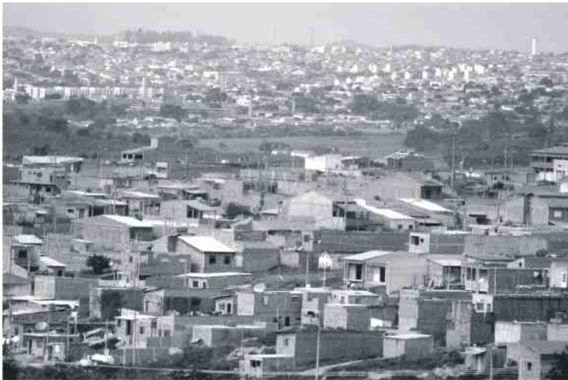
Registrar a casa em cartório e manter o imóvel regularizado na prefeitura, facilita na hora de vender ou comprar o patrimônio