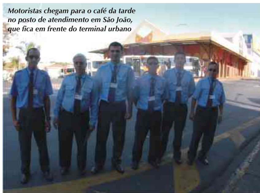
Motoristas chegam para o café da tarde no posto de atendimento em São João, que fica em frente do terminal urbano

As comemorações são mais que merecidas. A Rápido Luxo tem cerca de mil motoristas em seu quadro de funcionários e eles são os responsáveis diretos pela qualidade de nossos serviços.