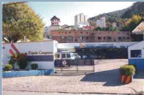
Reforma visa melhorar a conservação dos veículos

os motoristas, que dirigiam os veículos de uma marca e quebrava a cabeça da equipe de manutenção. "Adaptamos uma válvula-relê no eixo traseiro e os nove veículos da marca pararam de frear muito só na frente", conta. Foi mais uma solução encontrada para um outro perigo: veículos que freiam apenas as rodas dianteiras correm o risco de derrapar em pista molhada.