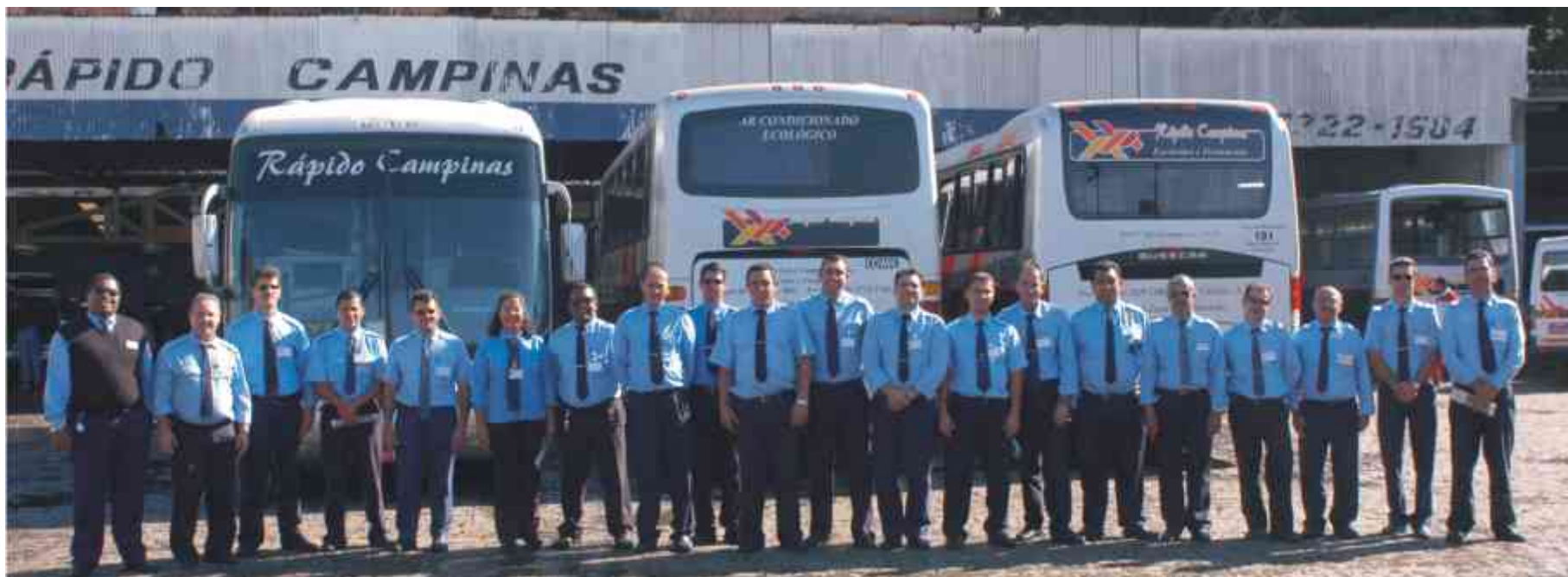
Motoristas de Poços de Caldas se reúnem antes do churrasco organizado na garagem: festa ocorreu durante todo o dia para contemplar os colaboradores de cada turn

Garagens comemoram Dia do Motorista, em 25 de julho, com café da manhã e brindes