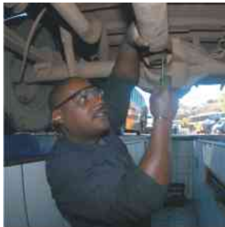
Válvula ajustada para funcionar o freio

U ma empresa como a Rápido Luxo Campinas só cresce e melhora a qualidade de seus serviços quando seus funcionários contribuem para melhorar o dia-a-dia na empresa. É o que ocorre, por exemplo, na garagem de Poços de Caldas, onde, a cada curso de que os colaboradores da Manutenção participam, trazem seus novos aprendizados e